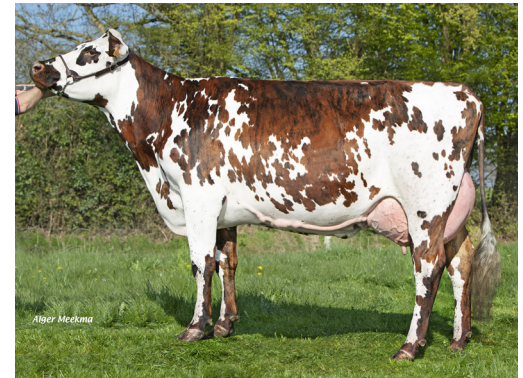
Sarcelle (Oltraford), mère de VICTINI

Au regard de l'ensemble de son profil, VICTINI est parfaitement taillé pour relever tous les défis que vous lui imposerez !