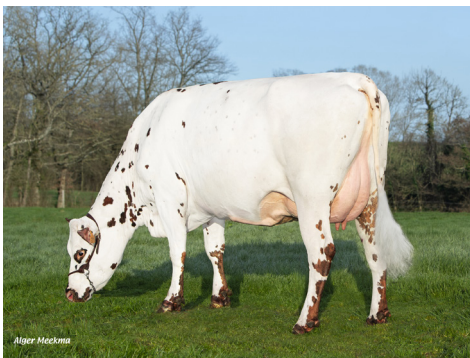
Toupie DBP (Pogba), mère de APOSTROPHE

» APOSTROPHE Sepia x Pogba (162, BB/A2A2) NEW