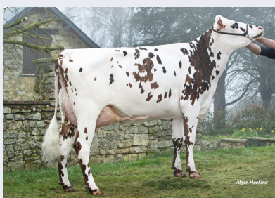
Undiana, fille de ROZEVIL de l'Earl Enjalbert (61)

Nous suivons ROZEVIL depuis quelques indexations et, aujourd'hui, ses index génomiques sont combinés aux contrôles de 65 filles et aux pointages de 35 filles . Il faudra viser des supports musclés, mais les réponses sur le lait , les membres et la santé mamelle seront bien là.