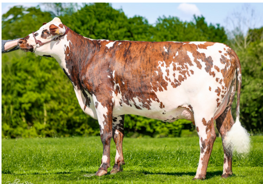
Talentueuse (Picard), mère de VEAUMANOIR