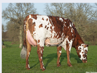
Varicelle, fille de RILEY JET au Gaec des Tamarlyses (61)