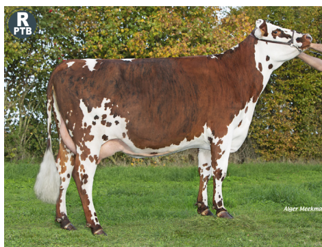
Upsilon (Paco BGT), mère de ATTILA LRV

» ATTILA LRV Stratego x Paco BGT (176, BB/A2A2) NEW